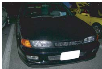
エランさんのパルサー エランの復活が 楽しみです