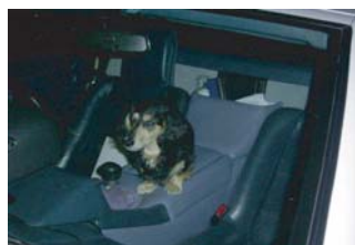
寒さに弱い プリン！