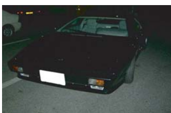
I葉さんのS3 カウンタックも 大好きです！