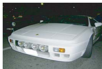
tamiさんのエスプリ チェンバレン仕様