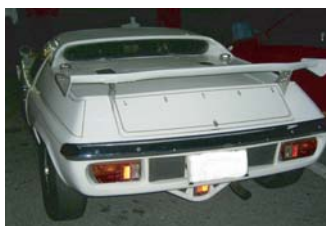
F91さんのヨーロッパ 久しぶりのNM