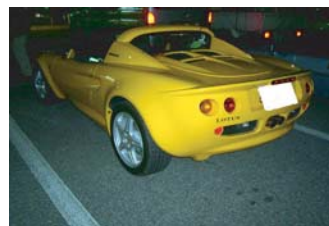
はみだし者さん！ ホーン有難う！