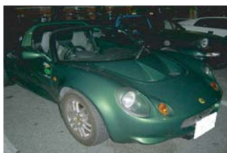
TTさんのエリーゼ 足回りリフレッシュ！ 前下がりで決まっています