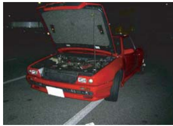
マセラッティシヤマルで2回目の参加！ ボンネットオープン有難うございます！