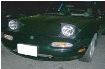
エリーゼに興味を 持たれたロードスター様