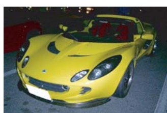
kajiさんのエリーゼ！サイドのカーボンエア ダクトが決まっています！