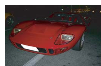
姫O40さんのGT40 自宅にサーキットが？ そうめん食べに行きます？