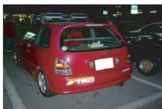
ぷりりんさんは エスプリと 旦那がお留守番！