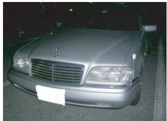
パンテラ400馬力！ しばらく我慢の jamesさん！