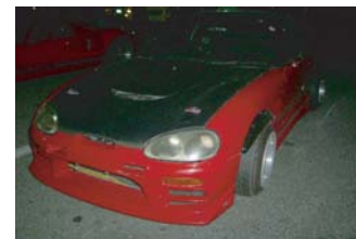
ヨーロッパ復活間近！ カプチーノで参加は O井さん