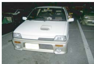
sazaoさんのアルト！ エリーゼの復活・・・ 待ち切れない様子