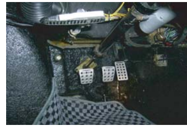
レーシーなコックピット！やる気がそそられます！ しばらくコックピットに収まらせて頂きました。もちろんエンジンONです！