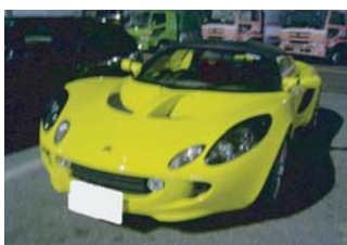
西日本以来！ 0様の111 S