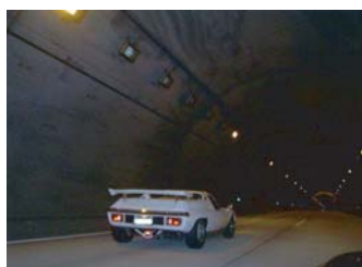
トンネルの心霊写真？ いやいや！F91さんのヨーロッパが爆走してます！