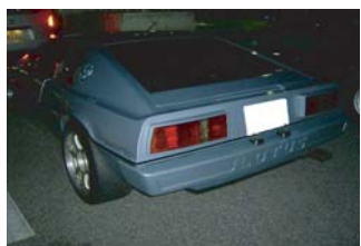
katoさんのエスプリS3 いつ見ても綺麗です！