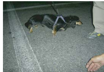
ウィルは寒さなんか へっちやら！