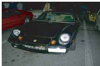
996 S P Sさんの ヨーロッパSP