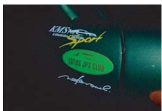
ニードルマウスのステッカー 貼ると10馬力アップ するらしい？